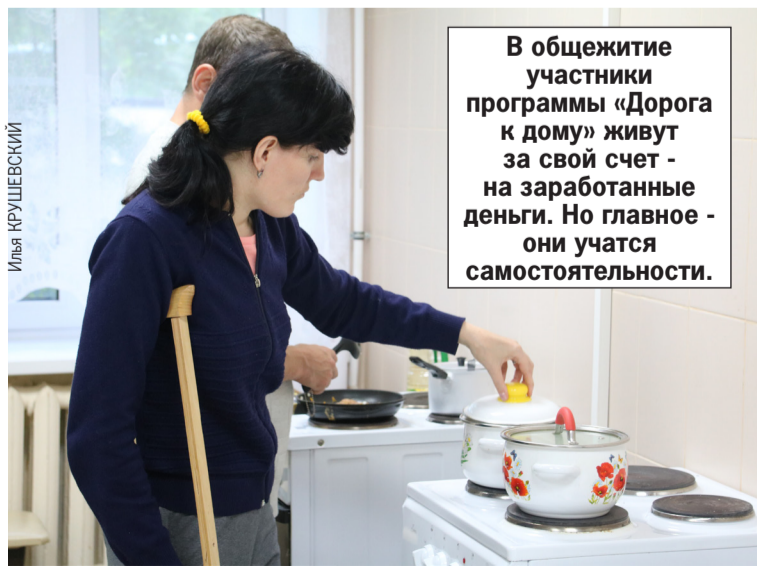
В общежитие участники программы «Дорога к дому» живут за свой счет - на заработанные деньги. Но главное - они учатся самостоятельности.

Наработанный проектный опыт «поддерживаемого проживания», несомненно, заслуживает внимания как в плане экономической целесообразности оптимизации бюджетных средств, высвобождающихся при выходе из стационарного учреждения дееспособных и трудоспособных граждан, так и в плане человечности к «людям с неравными возможностями», просто попавшим в непростую жизненную ситуацию.